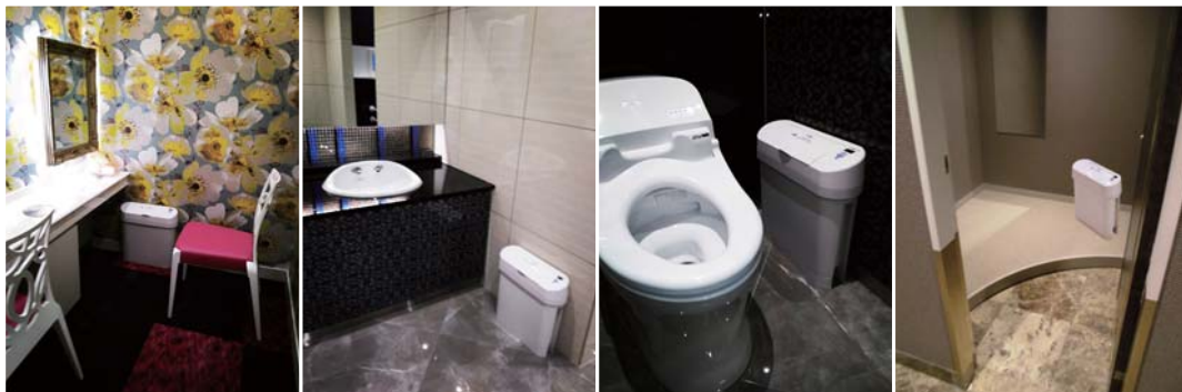
●化粧室で ●洗面スペースで ●トイレルームで ●フィッティングルームで