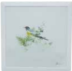
▲中の絵は自由に変更可能